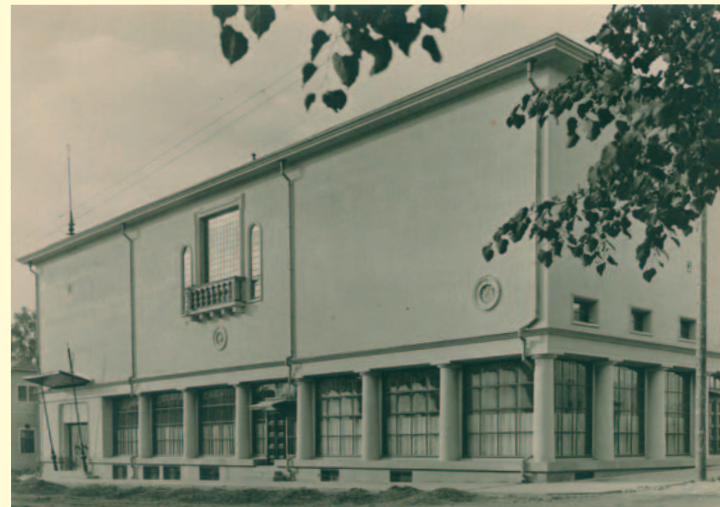
Jyväskylän Työväentalo vuonna 1925