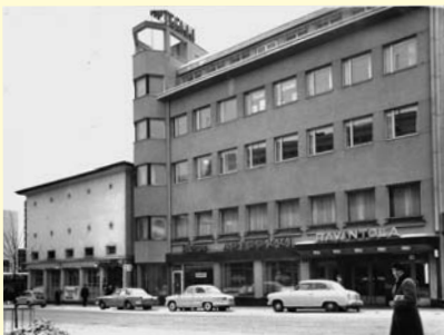
Kauppakatu 30 1960-luvulla.

Nykyään Aallon suunnitteleman rakennuksen rinnalla samalla tontilla sijaitsevat myöskin Jyväskylän Työväenyhdistyksen omistamat 1955 valmistunut toimistorakennus (Kauppakatu 30) sekä 1999 valmistunut asuinkerrostalo (As. Oy Jyväskylän Väinönkatu 7). Näistä Kauppakatu 30:n toimistorakennus kytkeytyy Aallon suunnittelemaan rakennukseen sen eteläpuolelta.