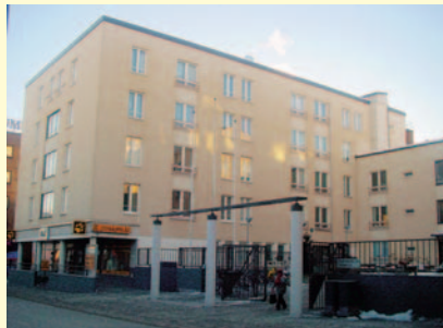
Väinönkatu 7 vuonna 2006.